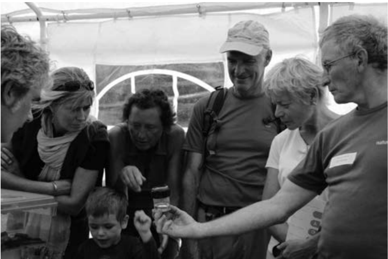
Stopplaats 4: Rijkdom aan fauna en flora in poelen en vennen - Waterhuishouding in het Maldegemveld

meestal plaats in minder waardevolle bosbestanden met uitheemse boomsoorten, terwijl de nieuwe bossen enkel streekeigen soorten zullen bevatten. De “jacht” op niet-streekeigen soorten is echter niet absoluut, zodat de grove den nog steeds zijn plaats zal vinden in het Drongengoed. Deze en tal van andere weetjes wisten de bezoekers duidelijk te boeien. Ook de kinderen deden gretig mee met het planten van zelf geknutselde bomen op een kaart van het Landschapspark. Hierbij herinneren we ons vooral dat deze bomen werden geplant of nabij de eigen woning of in het open gebied tussen de drie boskernen van het Landschapspark. Onze kinderen hebben duidelijk nog niet genoeg bos gezien en zien het Landschapspark volledig zitten: een duidelijk signaal naar onze beleidsmakers om hier ten gronde werk van te maken!