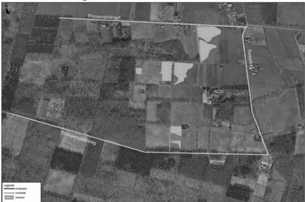
provinciaal project gestroomlijnd landschap splenter- en Edebeek:

een 150 man, regelmatig langs. Jef zorgde ervoor voor de nodige ondersteuning en verwelkomde de vele bezoekers. Etienne kon de wandelaar boeien door de rijkdom van waterdiertjes, kikkers en amfibieën uitvoerig toe te lichten. Hoe deze dieren zo typisch zijn aangepast aan het leven in en rond het water werd enthousiast verteld en boeide vele mensen en kinderen. De kinderen konden daarnaast ook zelf (water)diertjes maken met klei, Marleen zorgde voor de nodige animatie en kneedwerk. Kurt belichte uitvoerig waarom en waar (zie onderstaande kaart) er poelen, plasdras zones en vennen werden of worden gegraven in het MV en hoe we hierdoor de waterberging van 10000 m 3 water bij hevig regenval kunnen bewerkstelligen.