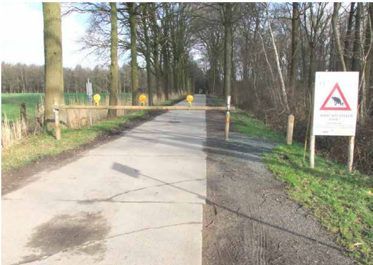
Bareel kruispunt Drongengoedweg-Westvoordestraat

De paddenoverzet in het Drongengoed is aan zijn 8-ste jaargang toe. In die tijd zijn er vele 1000-duizenden kikkers, padden en salamanders veilig de Drongengoedweg kunnen passeren in hun trektocht naar hun voortplantingspoel. Wat destijds begon met het plaatsen van een amfibieënscherm is met de jaren geëvolueerd naar het afsluiten van de Drongengoedweg tussen de Westvoordestraat en de Krakeelparking verderop richting Jagershof. Wat tot vorig jaar gebeurde met nadars, die door de gemeente Knesselare en Maldegem werden aangeleverd, gebeurt nu met 2 baren die 's avonds worden dichtgezet en 's morgens terug open. Dat is een hele verbetering, het dichtleggen van een bareel is heel wat gemakkelijker dan het sleuren met die zware nadars.